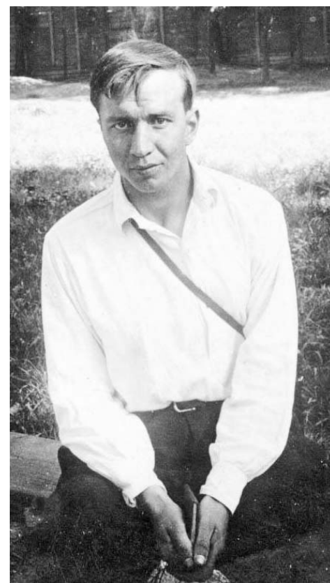
Именем этого талантливого исследователя и замечательного человека назван информационный Центр Сихотэ-Алинского заповедника.